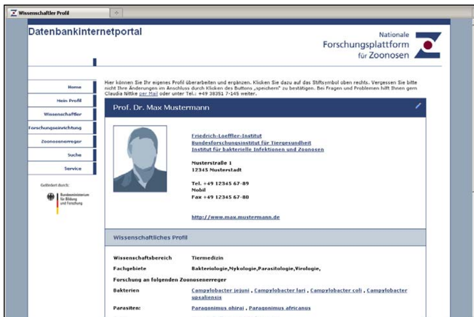
Abbildung 3. Screenshot eines Wissenschaftlerprofils